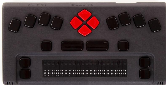
برجسته نگارهوشمند همراه، تولید شرکت پکتوس