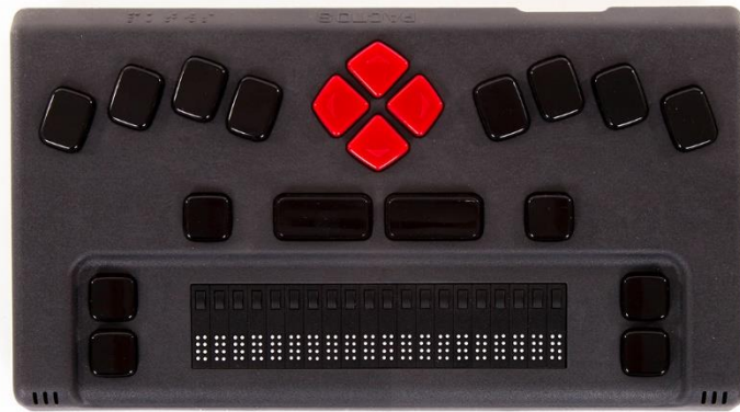
برجسته نگار هوشمند همراه، تولید شرکت پکتوس