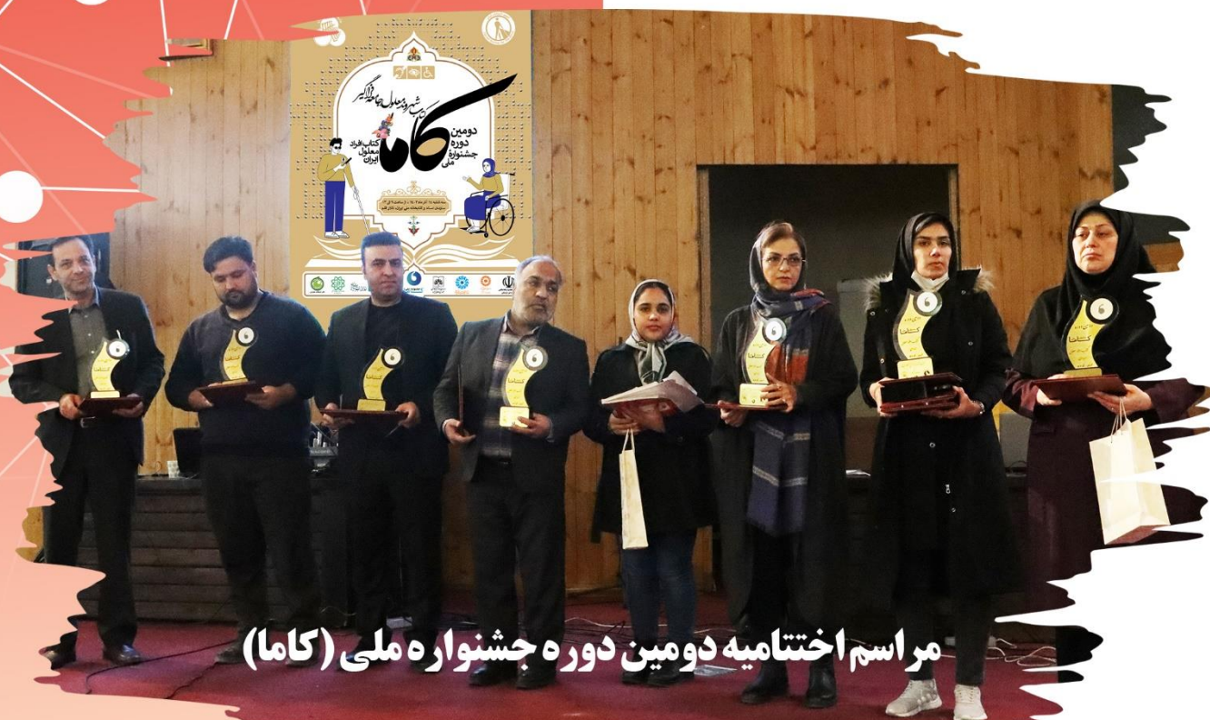
مراسم اختتامیه دومین دوره جشنواره ملی (کاما)