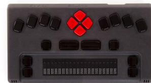
برجسته نگاروشمند همراه، تولید شرکت پکتوس