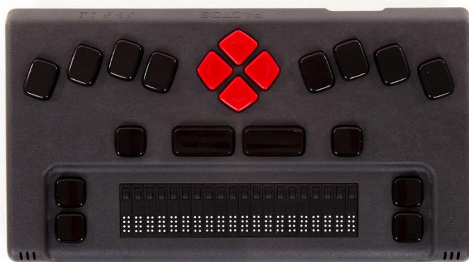
برجسته نگار هوشمند همراه، تولید شرکت پکتوس